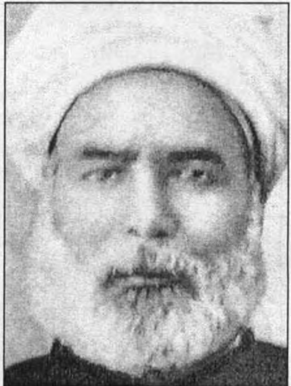
الإمام محمد عبده