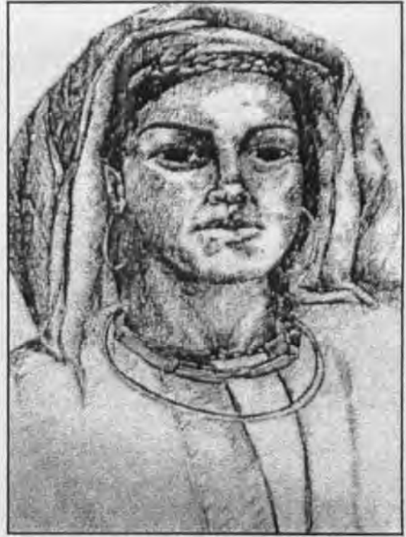
الخنساء (تماضر بنت عمرو بن الحارث)