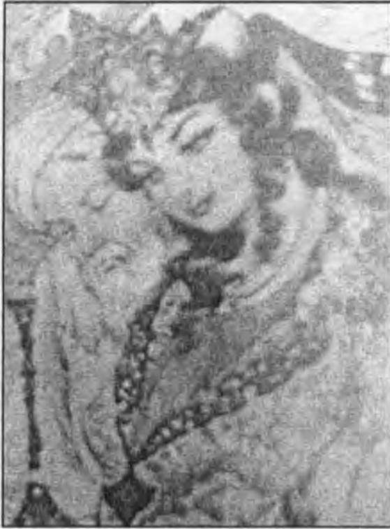
صفحة من صفحات عمر الخيام