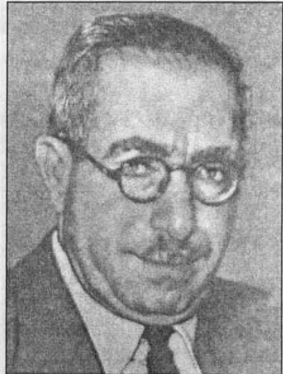
محمد حسنين هيكل