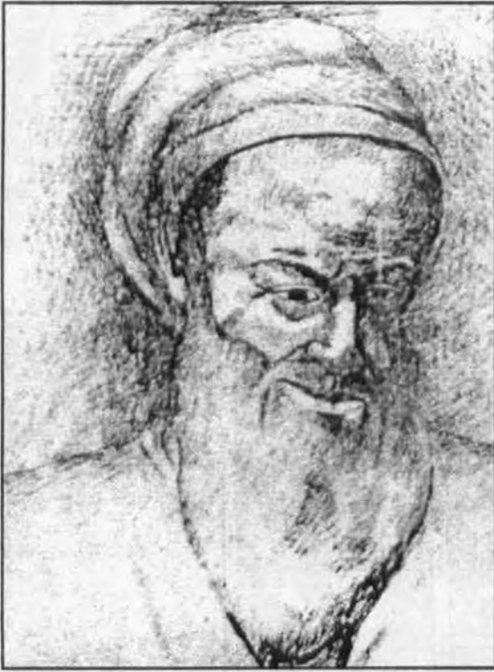
حسان بن ثابت