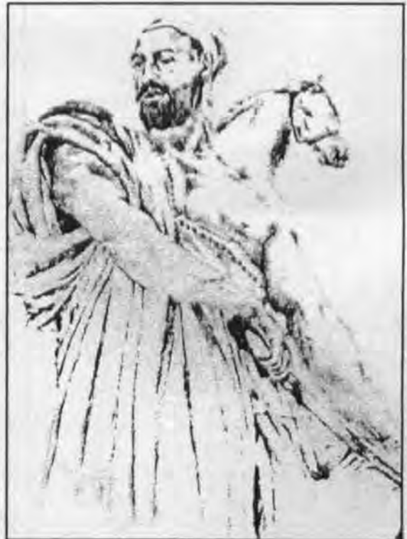
عنتر بن شداد