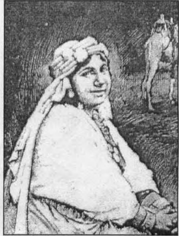
ملك حفنى ناصف