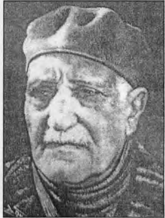
عباس محمود العقاد