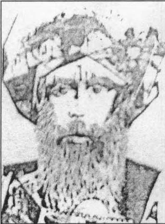
مالك بن أنس