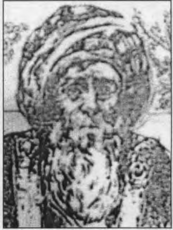
الخليل بن أحمد