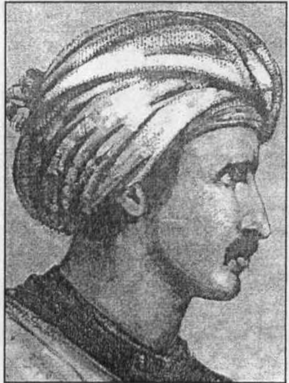
رفاعة رافع الطهطاوى