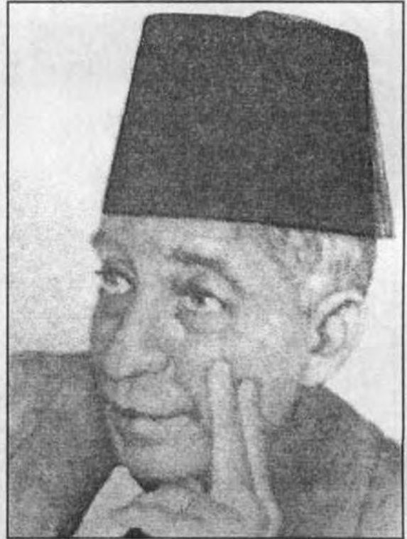
إبراهيم عبد القادر المازني