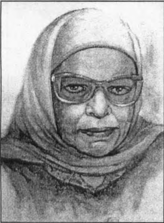
عائشة عبد الرحمن