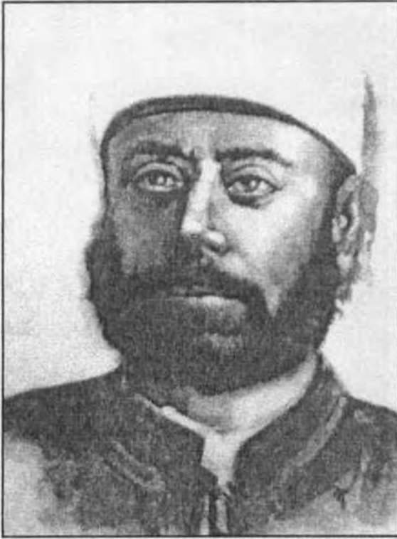
عبد الرحمن الكواكبي