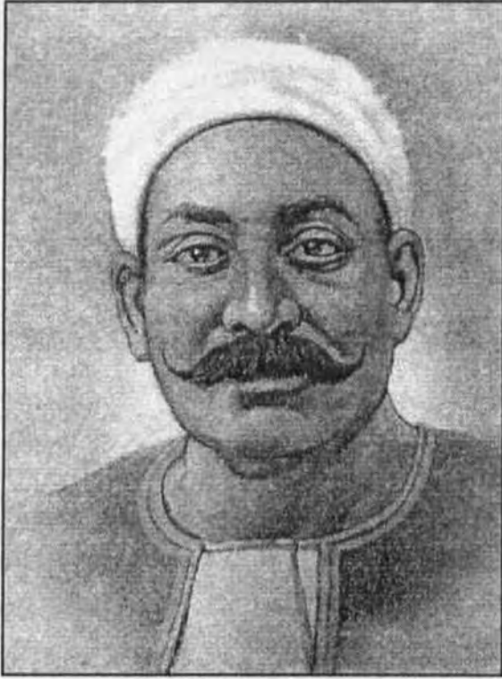
مصطفى لطفى المنفلوطى