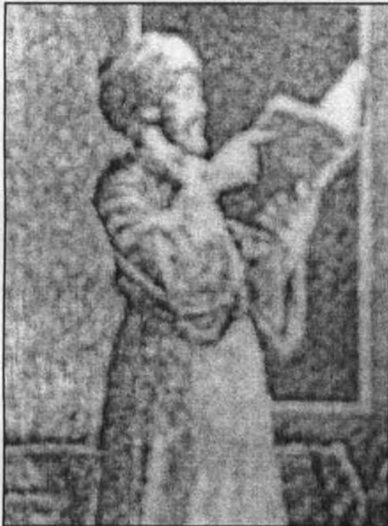
مصطفى لطفى المنفلوطى